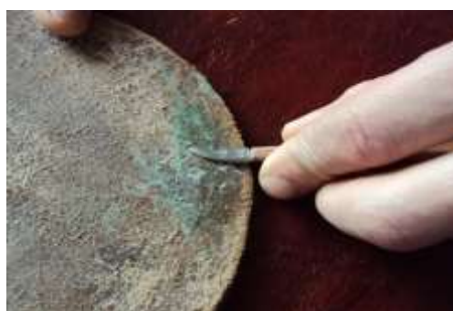
e) pichoqni oʻtkirlash;