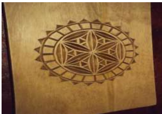
a) kesish taxtasi