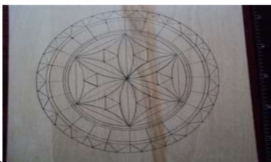
v) yog'ochga naqsh chizish

Birinchi bosqich ishni boshlash uchun avvalo biror bir naqsh tanlab trafaret tayyorlab olamiz yoki tayyor trafaretdan foydalanamiz va ma'lum o'lchamdagi yog'ochni kesib yog'och ustiga qalam yordamida shaklni tushuramiz.