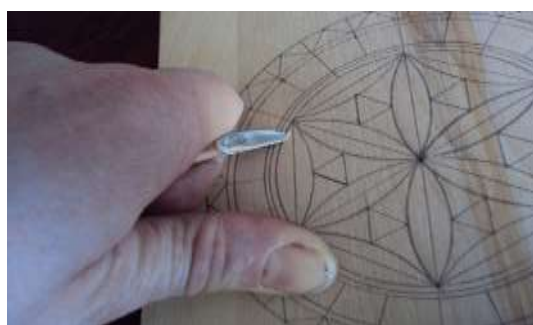
g) yog'ochni pichoq yordamida o'yish;