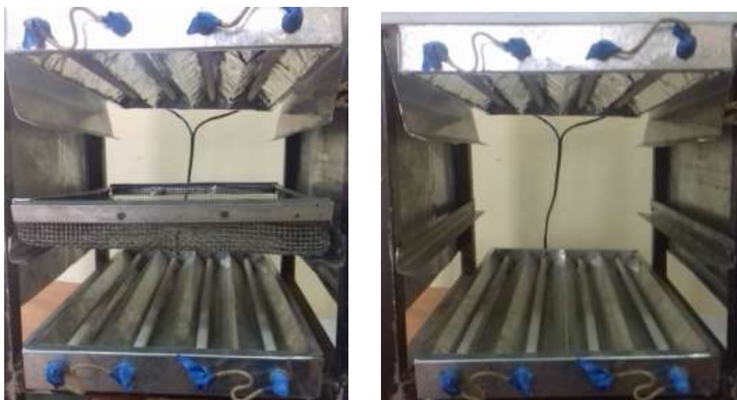
1-расм. Функционал керамика асосидаги инфрақизил синов қуритиш қурилмаси

Усуллар. Физика соҳасидан маълумки, инфрақизил нурланиш қизиган жисмлардан тарқалиши, қишлоқ хўжалик маҳсулотларини қуритиш, қайта ишлаш соҳасида кенг фойдаланилиши барчамизга маълум. Лекин маҳсулотлар таркибидаги сув миқдорини мақсадли камайтириш учун нурланишни маълум бир даражада бошқариш лозим. Инфрақизил нурлар кўпгина жисмларда танланган холда ютилади, хавода умуман ютилмайди, лекин сувда инфрақизил нурларнинг ютилиш коэффиценти жуда баланддир (1-расм) [1-3].