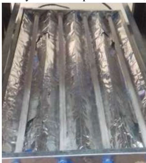
2-расм. Функционал керамика қопланган ҳамда фолга қоғози қайтаргичга қопланган нурлатгич

Эжекторлар 0,2-0,4 мм қалинликдаги тунука металл қопламадан қурилманинг ўлчамига қараб бурчак шаклдаги мосламада тайёрланади. Эжекторларни жойлаштиришда қопламанинг маҳсулотга қаратилган томонининг йўналишини давом эттирганда, маҳсулот солинган таглик (тортма) нинг марказига тўғри келишини назорат қилиш зарур. Бунда ишчи зонадан буғланган намликни олиб чиқиб кетиш учун ҳаво сўргичларни ишлашига сарфланаётган қўшимча энергия тежаб қолинади [4-7].